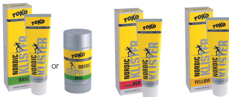
Base Gripwax green or Klister green