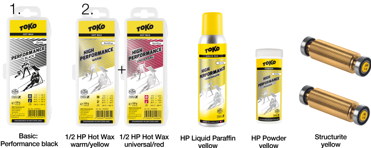
Basic: Performance black

Reccomandation: Recommandés: Consigliati: