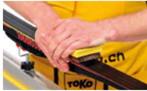
Base Brush Copper