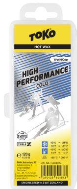
HP Hot Wax blue

Reccomandation: Recommandés: Consigliati: