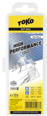
HP Hot Wax blue

Reccomandation: Recommandés: Consigliati: