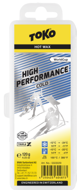
HP Hot Wax blue

Reccomandation: Recommandés: Consigliati: