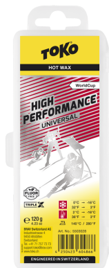
HP Hot Wax universal/red

Reccomandation: Recommandés: Consigliati: