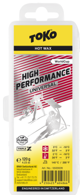
HP Hot Wax universal/red

Reccomandation: Recommandés: Consigliati: