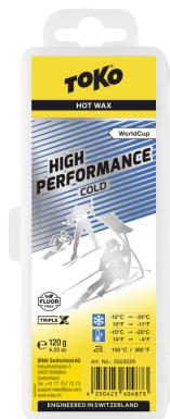
HP Hot Wax blue

Reccomandation: Recommandés: Consigliati: