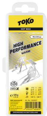
1/2 HP Hot Wax yellow

Reccomandation: Recommandés: Consigliati: