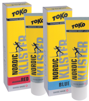
1. Layer Klister red & blue mixed