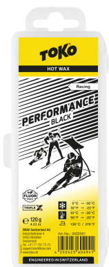
1/2 Performance Hot Wax black