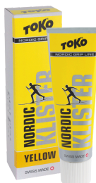
Nordic Klister Yellow