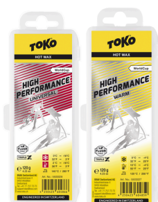
HP Hot Wax Universal and Warm 1:1