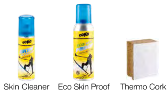
Skin Cleaner Eco Skin Proof Thermo Cork

Pulire la pelle con Skin Cleaner prima del trattamento con la sciolina.