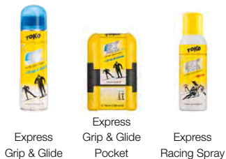
Express Grip & Glide Express Grip & Glide Pocket Express Racing Spray

Prima di applicare la sciolina pulire sci e squame con Waxremover.