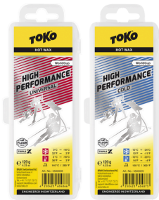
HP Hot Wax Universal and Cold