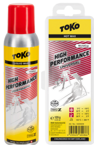
HP LP Red or HP Hot Wax Universal