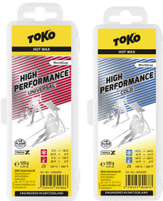
HP Hot Wax Universal & Cold (50/50)