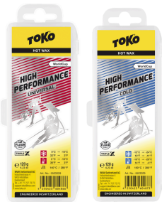
HP Hot Wax Universal & Cold (50/50)