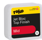
Jet Bloc Top Finish Mid