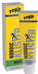
Nordic Klister Base Green ironed