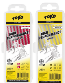
HP Hot Wax Universal and Warm 3:1