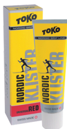
Nordic Klister Red and Yellow 2:1